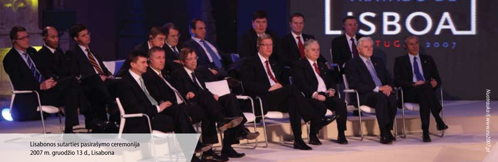
Lisabonos sutarties pasirašymo ceremonija 2007 m. gruodžio 13 d., Lisabona

ant pasirašytos Nicos sutarties ir pačiai sutarčiai įsigaliooti jau buvo pradėta rengti nauja Sąjungos reforma. Nors Nicos sutartis įsigaliojo tik 2003 m. vasario 1 d., Europos ateities konventas, turėjęs parengti naują sutartį, darbą pradėjo jau 2002 m. vasario 28 d.