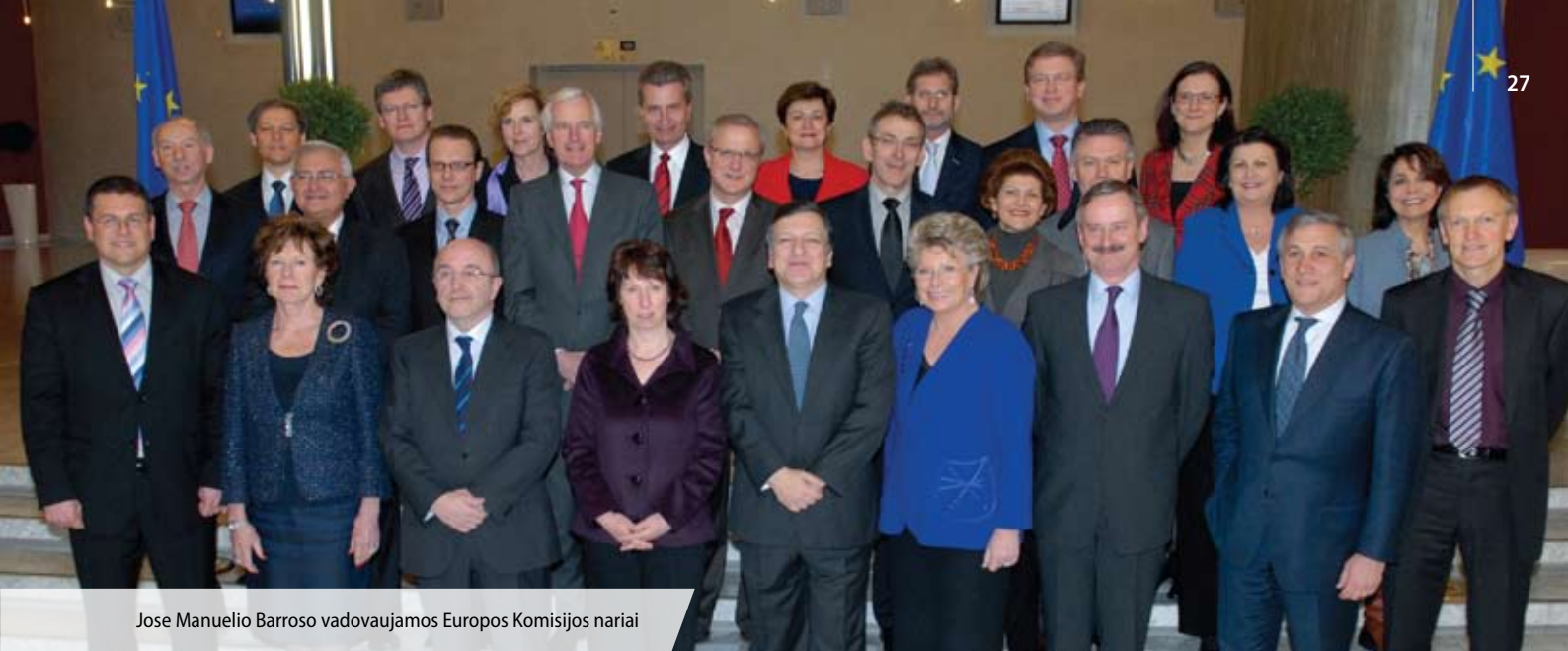
Jose Manuelio Barroso vadovaujamos Europos Komisijos nariai

giai skirta Sąjungos valstybių naudai ar nenaudai. Tai viso labo tėra sprendimų priėmimo sistemos patobulinimas. Bet pati sprendimų priėmimo sistema visai nerodo, kokie sprendimai bus priimami. Tai jau priklauso nuo aplinkybių ir nuo jomis veikiančių politikų. Čia tiktų palyginimas su futbolu. Jeigu ES veiklą laikytume futbolo žaidimu, Lisabonos sutartis būtų žaidėjų susitarimas dėl taisyklių keitimo ir tobulinimo. Bet juk vien susipažinęs su taisyklėmis negali pasakyti, kuri komanda laimės varžybas. Taisyklės galima vertinti tik pagal tai, ar jos yra aiškios ir nedviprasmiškos, o svarbiausia, vienodos visiems dalyviams. Žvelgdamas būtent