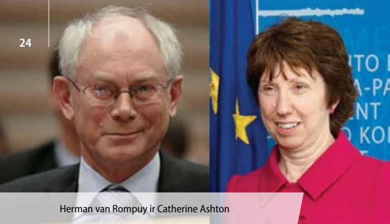
Herman van Rompuy ir Catherine Ashton