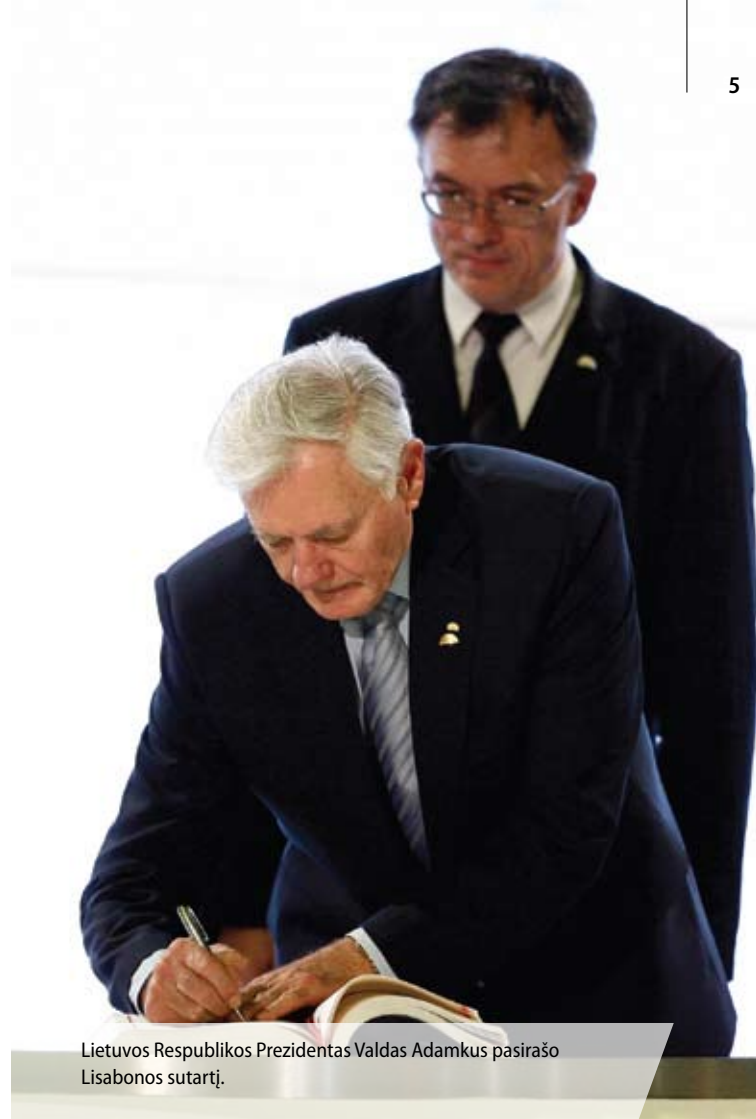
Lietuvos Respublikos Prezidentas Valdas Adamkus pasirašo Lisabonos sutartį.